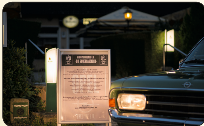
Benzingespräche am ALT-OPEL-FREUNDE-Stammtisch

Gerd Forst, Tel. (0) 176 320 395 56 (18:00-21:00 Uhr) Tobias Bredfeld, Tel. (0) 520 249 6002 (18:00-21:00 Uhr)