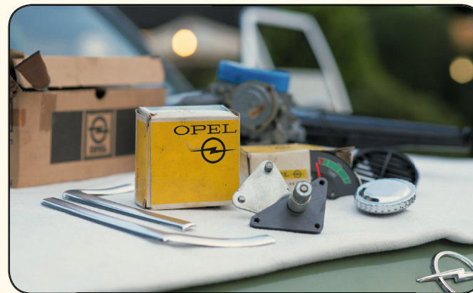
Ersatzteile – auch für Euren OPEL!